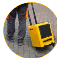
Infällbart praktiskt handtag