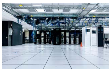
Datacenter och telecom