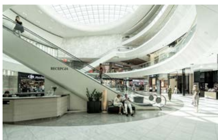
Byggnader och kommersiella utrymmen