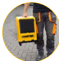
Kompakt och låg vikt

DHP 20 är en liten och lätt byggtork i robust rotationsgjuten hölje designat för professionell användning i utmanande arbetsvillkor. Den lätthanterliga enheten levereras som standard med en inbyggd, integrerad vattenpump och erbjuder snabb och effektiv torkning i små utrymmen efter vattenskador, under byggnadsarbeten med mera.