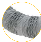
Luftkanal, 5m, Ø10cm - 1250108