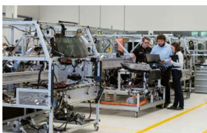
Industri och produktion