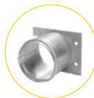
Luftkanal anslutningsadapter - 1306539

Rotationsgjuten teknik används ofta för att göra robusta produkter som kajaker och lekredskap