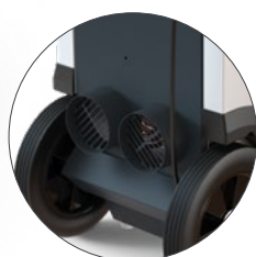
AD 935 S med 1kW elvärmeelement och 2x Ø100mm kanalanslutningar