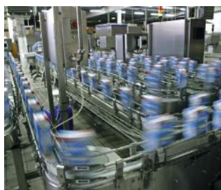
Industrielle prosesser og næringsmiddelindustri