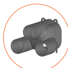
Slangeadapter 1 x 50mm 1 306 553