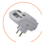
Plug-in hygrostat (10–90 % RF/ 10–60 °C) 1430047