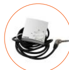
Hygrostat med 3m kabel, jack plugg og beslag 1 110 552