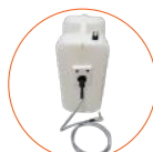
Vanntank 1 110 561