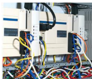
Datasentre og telekom