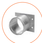
Slangeadapter 1 x 100mm 1 306 539