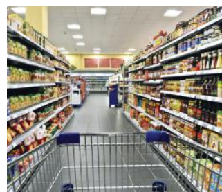
Bygg og anlegg