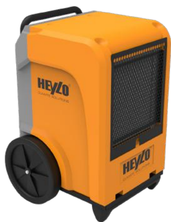
HEYLO KT 45