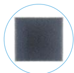
Utskifting av luftfilter 490146