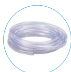
Kondensatavløpslange 490100 12 x 2mm