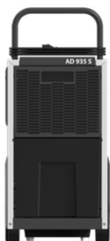
AD 935 S