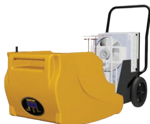
Nem at åbne for rengøring

De højeffektive DHP 55 affugtere er ideelle til udtørring af små lækager, oversvømmelser og lignende inden for byggeri, industri og bolig. Det korrosionsbestandige rotationsstøbte hus er designet til professionel brug for udlejningsfirmaer, byggefirmaer med flere, og gør enhederne meget robuste og derfor perfekte til en række udfordrende arbejdsforhold. Eksempler er områder som kældre, lagerbygninger til fødevareopbevaring, arkiver, museer, biblioteker, garager og tørrerum. Generelt er den nyttig i forbindelse med restaurering efter oversvømmelse eller tørring efter byggearbejde. I modsætning til de fleste andre mobile affugtere har DHP 55 indbygget vandpumpe som standard. Den har også et digitalt kontrolpanel med en timetæller, en 3m afløbsvandslange og en valgfri 5l vandtank.