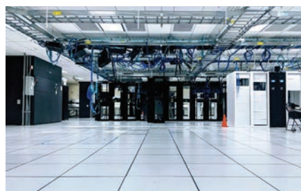
Datacentre og teleselskaber