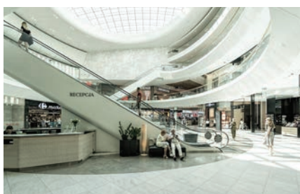
Bygninger og erhvervsarealer