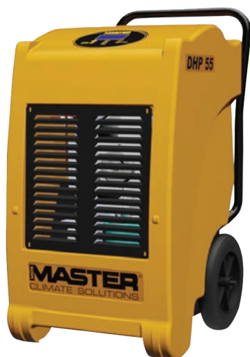
DHP 55 PATENTERET