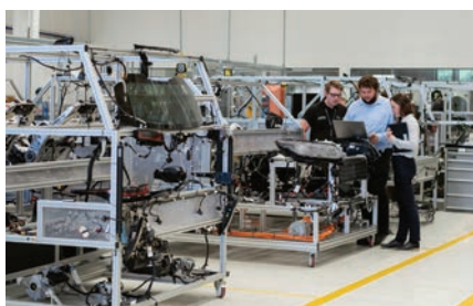
Generel industri og produktion