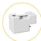
Vandtank 5l 4250.320